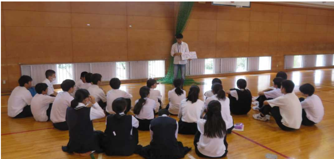
②（1回目）同じグループの全員で、同じ人の物語を聞いている様子